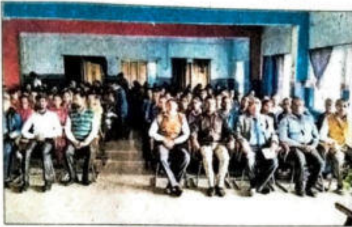
राष्ट्रीय शिक्षा नीति पर आयोजित संगोष्ठी में मीजूद प्रशिक्षु।

आरा। आईक्यूएसी के अंतर्गत राष्ट्रीय शिक्षा नीति (2020) पर माता मंझारो अजब दयाल सिंह टीचर्स ट्रेनिंग कॉलेज भोजपुर, अपसम कॉलेज भोजपुर, बाबा हीरा सिंह, दीपा सिंह जी प्राइमरी टीचर्स ट्रेनिंग कॉलेज भोजपुर, माता मंझारो अजब दयाल सिंह महाविद्यालय, भोजपुर के संयुक्त तत्वावधान में संगोष्ठी की गई।