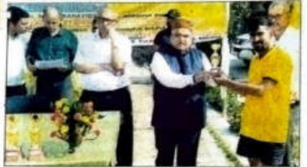
पुरस्कृत करते अतिथि।

डीके कारमेल ग्रुप का स्पोर्ट्स टूर्नामेंट का समापन आरा (एसएनबी)। माता मंझरो अजब दयाल सिंह टीचर्स ट्रेनिंग कॉलेज, दुलौर, जगदीशपुर, अपसम कॉलेज ऑफ एजुकेशन, उत्तरवारी जगल जगदीशपुर, बाबा हीरा सिंह सिंह जी प्राइमरी टीचर ट्रेनिंग कॉलेज