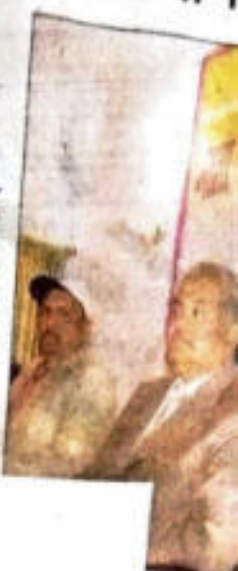
आग मात मन्सरो अकबरवाल सिंह टीकम ट्रेनिंग कॉलेज तथा संमिनार का संवादन अनुदान ओझा ने किया। संमिनार में भाग लेते लोग