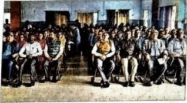
गोष्ठी में उपस्थित छात्र - छात्राएं.