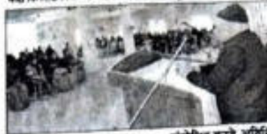
संवेदीय करने अतिथि।

आग (एसएनसी)। अल्पकालीन अल्प-संख्यक जनता को एक राष्ट्र के निर्माण में शिक्षकों की भूमिका क्या है? यह प्रश्न हमें आज का समय याद दिलाता है। अल्पकालीन अल्प-संख्यक जनता को एक राष्ट्र के निर्माण में शिक्षकों की भूमिका क्या है? यह प्रश्न हमें आज का समय याद दिलाता है। अल्पकालीन अल्प-संख्यक जनता को एक राष्ट्र के निर्माण में शिक्षकों की भूमिका क्या है? यह प्रश्न हमें आज का समय याद दिलाता है।