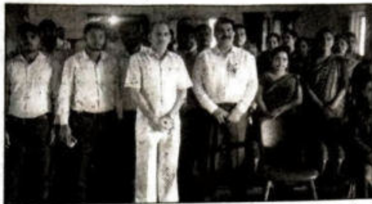
कार्यशाला में उपस्थित लोग।

आरा (एसएनबी)। इंटर्नल क्वालिटी एश्युरेंस सेल (आईक्यूएसी) के अन्तर्गत लीडरशिप मैनेजमेंट का एकदिवसीय कार्यशाला का आयोजन माता मंझारो अजब दयाल सिंह टीचर्स ट्रेनिंग कॉलेज, भोजपुर, अपसम कॉलेज ऑफ एडुकेशन भोजपुर, बाबा हीरा सिंह दीपा सिंह जी प्राइमरी टीचर्स ट्रेनिंग कॉलेज कोथुआ भोजपुर के सम्मिलित सहयोग से मैनेजमेंट लीडरशिप पर एकदिवसीय कार्यशाला का उदघाटन प्रसिद्ध मैनेजमेंट गुरु प्रकाश