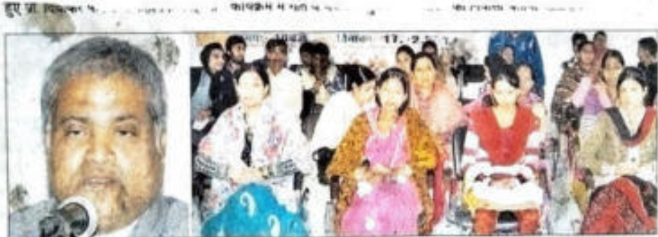
सेमिनार में भाग लेते लोग