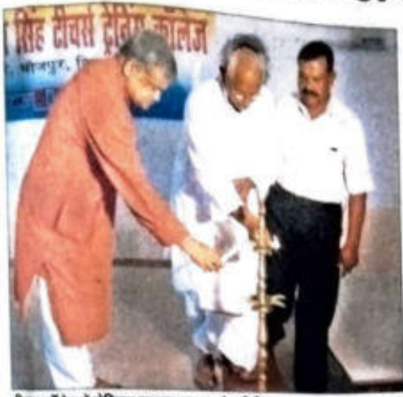
बीएच कॉलेज में सेमिनार का उद्घाटन करते अतिथि

बदलते भारतीय परिवेश में पत्रकारिता की भूमिका विषय पर सेमिनार