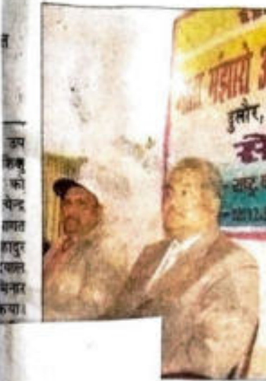
19 दिसंबर 2013